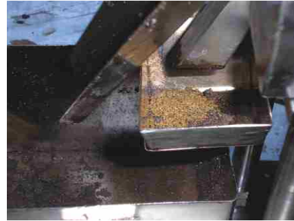
Золото из магнитожидкостного сепаратора

черновых концентратов, получаемых как со шлюзов, так и с помощью центробежных концентраторов, что определяет наличие металла широкого диапазона крупности.