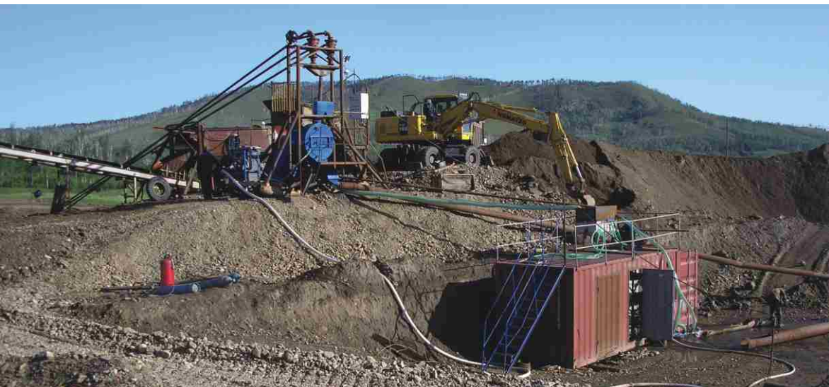
Передвижной доводочный комплекс, установленный в контейнере (на фото внизу справа), на горном участке предприятия