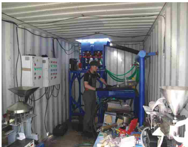
Обогащительный комплекс (вид внутри) включает технологическое оборудование, оптимальное для перерабатываемого сырья

Комплекс доводки снабжен системами освещения, приточно-вытяжной вентиляции и отопления и соответствует внутренним требованиям сохранности металла на предприятии.