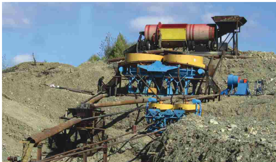
Обогатительный комплекс с отсадочно-центробежной технологией обогащения в Приморье