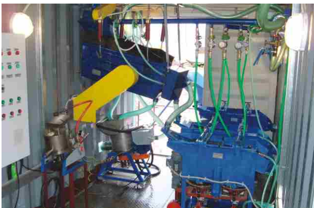
ПМГОУ-100 — модульная геологоразведочная установка. Участок классификации и гравитационного обогащения