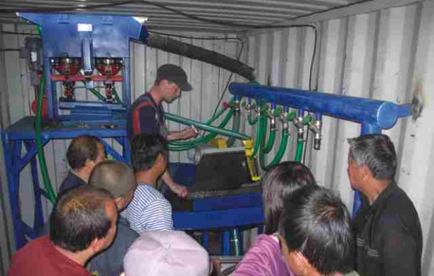
Модуль для доводки золотосодержащих концентратов: отсадка, мокрая магнитная сепарация и концентрация на столе. На фото обучение специалистов предприятия