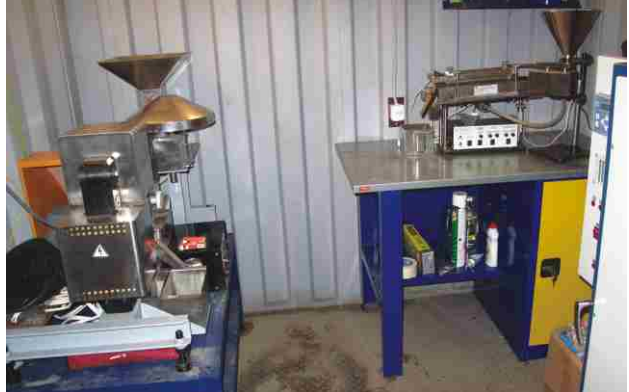
Отделение сухой доводки золотосодержащих концентратов: сухой и магнитожидкостный сепараторы ИТОМАК